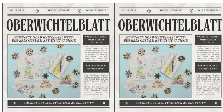
Wichtelzeitung in Wichtelgröße